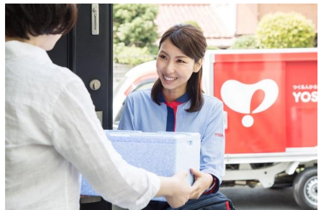
「ヨシケイの配達スタッフである スマイルスタッフ がお届け」

このような環境下、ヨシケイグループでは スマイルスタッフ が Face to Face を大切に、直接手渡しを基本に、毎日自社便で食材をお届けしています。不在の場合は、お客様の玄関先などご指定の場所やあんしん BOX 内にお届けしています。単なる食材の配達ではなく、笑顔の見える「食卓」づくりのお手伝いをしているとの自覚で、お客様との接点を大切にしています。 スマイルスタッフ は正社員として雇用され、お客様に対してきちんとした対応ができるよう、しっかりと研修を受けています。現在毎日 4,100 台の自社便で全国 289 の営業所から、約 50 万世帯のお客様に食材をお届けしています。