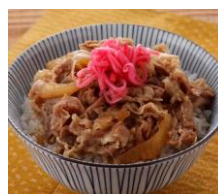
栄養士が作った おいしい牛丼