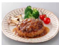
こんがりジューシー 和風ハンバーグ