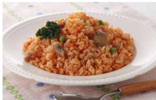
完熟トマト使用 彩り具材のチキンライス