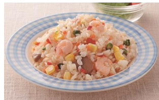
えびとバターの コクが引き立つえびピラフ