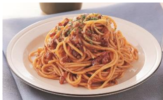
牛肉と完熟トマトをじっくり 煮込んだミートソーススパゲティ