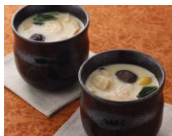
7種具材の茶わんむし