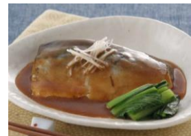
骨までおいしい 国産さばの味噌煮