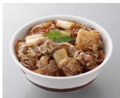
お肉と野菜の旨み広がる 牛すき丼