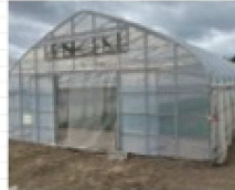
小松菜のハウスは77棟（約2ha）あります。

肥料や水をやると、土の場合は横に広がりますが、砂地は下にまっすぐに落ちます。水はけが良い分、養分も流れてしまうというわけです。そのため、普通の農家の倍近くの肥料を使って、よい状態を維持しています。