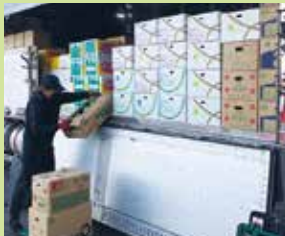
仕入れた野菜は本社製造部に運ばれカットした後、各営業所へ皆さまのご家庭へお届けされます。