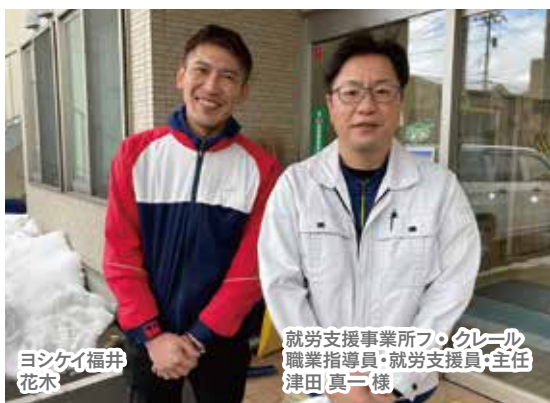
ヨシケイ福井 花木