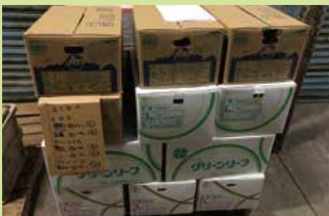
取材で訪問したらヨシケイのレタスがキープされていました！