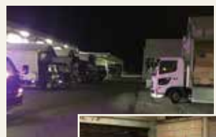
全国の生産者から24時間野菜と果物が武生青果に届きます。

県内はもちろん、県外や世界中の野菜や果物を、福井県内の消費者の皆さんにお届けするのが武生青果の仕事です。にんじん、じゃがいも、きゅうり、トマト、果物などを、スーパー、小売業者、食品工場などに卸します。産地から毎日、「明日届く野菜・果物は何ケースですよ」という連絡が届きます。また、スーパーなどからの発注もあります。それらをマッチングするのが主な仕事です。自然相手の仕事ですから、産地から届く数と注文数がぴったり合うなんてことはまずありません。産地から入ってくる数が少ないとわかったら、近隣他県の市場などに仕入れの交渉を行います。逆に多く収穫されて余りそうな時は、取引先や他県の市場に仕入れてもらえないか連絡。天候や自然災害に左右されながら、産地廃棄にもならないよう、毎日安心安全なものを精一杯お届けするために緊張感を持って一所懸命やっています。