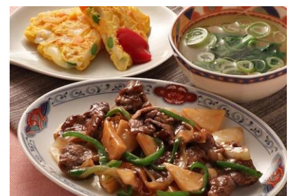
チンジャオロース オムレツ／スープ（青菜・太葱）