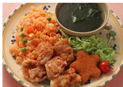
ワンプレート （若鶏のから揚げ&星のコロッケ） ケチャップライス／わかめスープ