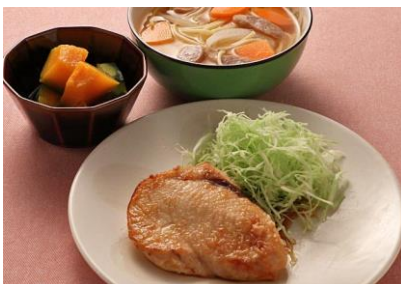
めかじきのムニエル かぼちゃの甘煮 ／ウインナーと野菜のパスタスープ